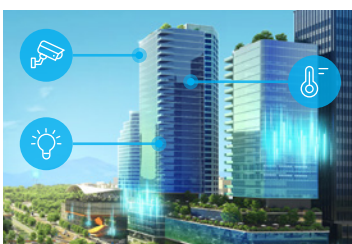
楼宇自动化和家庭自动化